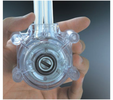
3. 适当拉紧软管，合上另一半泵头外壳。