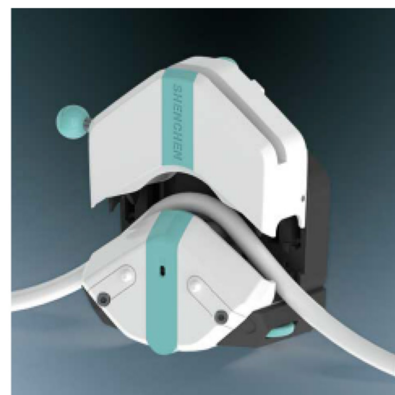
3. 将软管自然放入上压块和滚轮之间。