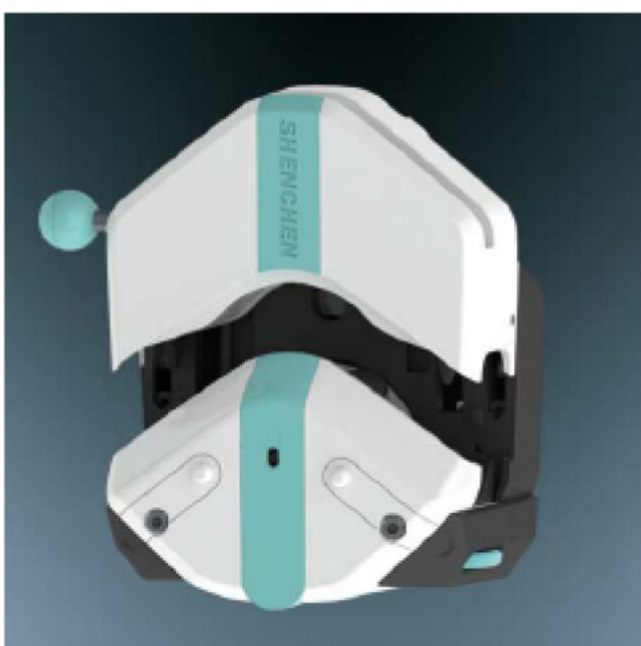
1. 逆时针扳动扳杆180°，打开压块。